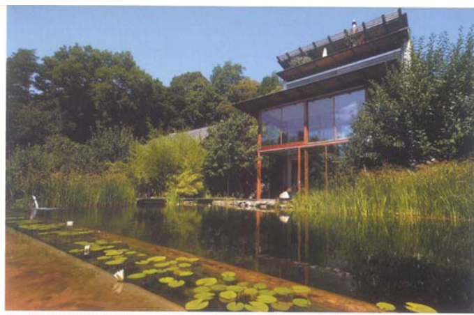
Design Ablinger, Vedral + Partner Location Vienna, Austria